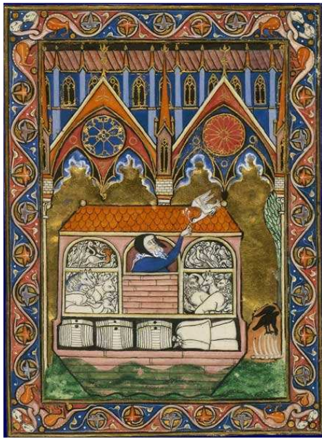
Noé et la colombe, Psautier de St-Louis , XIII e

Cette étonnante présentation a ouvert les portes d'un code millénaire que les personnes présentes pourront maintenant exploiter dans leurs futures visites de sites religieux et parcours de documents anciens. Nul doute que le Moyen âge a forgé notre culture et que ce type de conférence nous permet de renouer avec nos racines