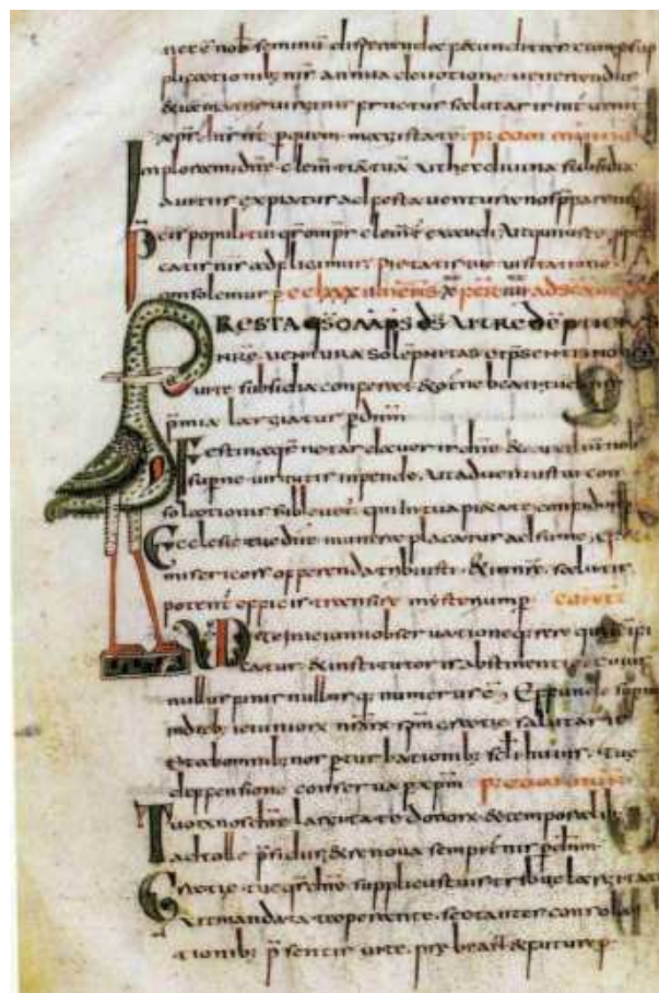
Illustrations de la BNF