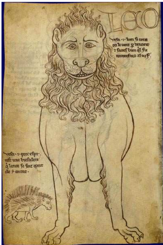
Faune, Villard de Honnecourt, XIII e

De nombreux animaux ont encore gardé aujourd'hui leur "réputation", ne dit-on pas rusé comme un renard, se tailler la part du lion, monter sur ses grands chevaux ou un ours mal léché sans parler du toujours funeste corbeau, noir et au cri sinistre. L'art de la chasse exploite également le caractère de chaque animal pour en déjouer les ruses.