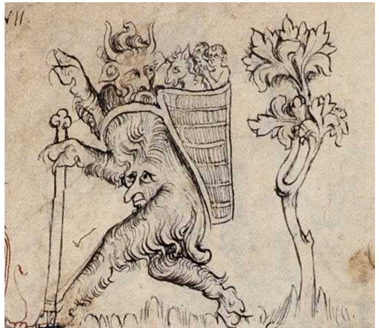
Le roman de Fauvel, Gervais du Bus, XIV e