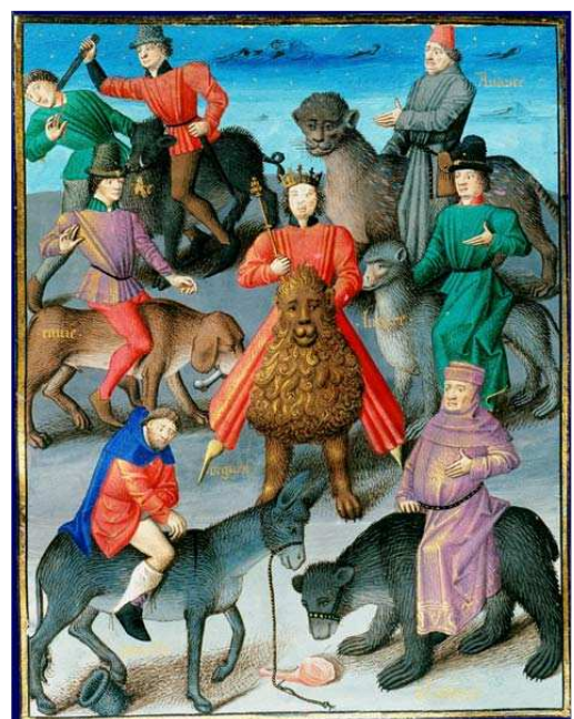
Les pêchés capitaux, Vincent de Beauvais, XV e