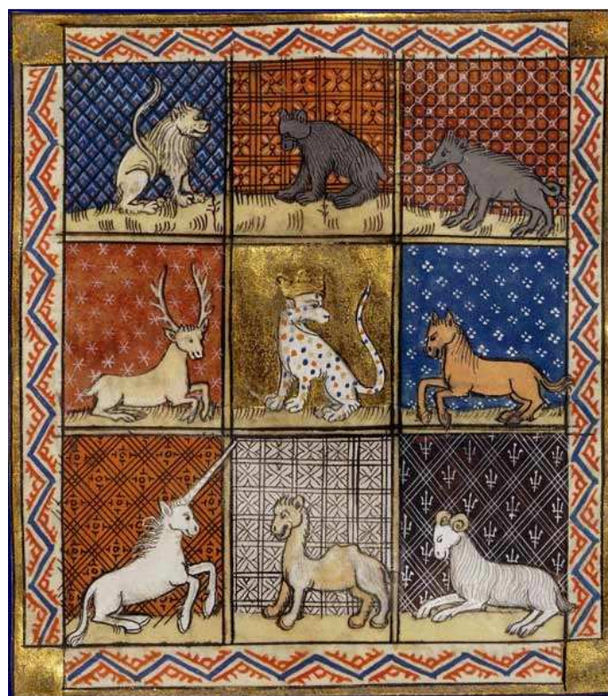
Psautier dit de saint Louis et de Blanche de Castille - XIIIe