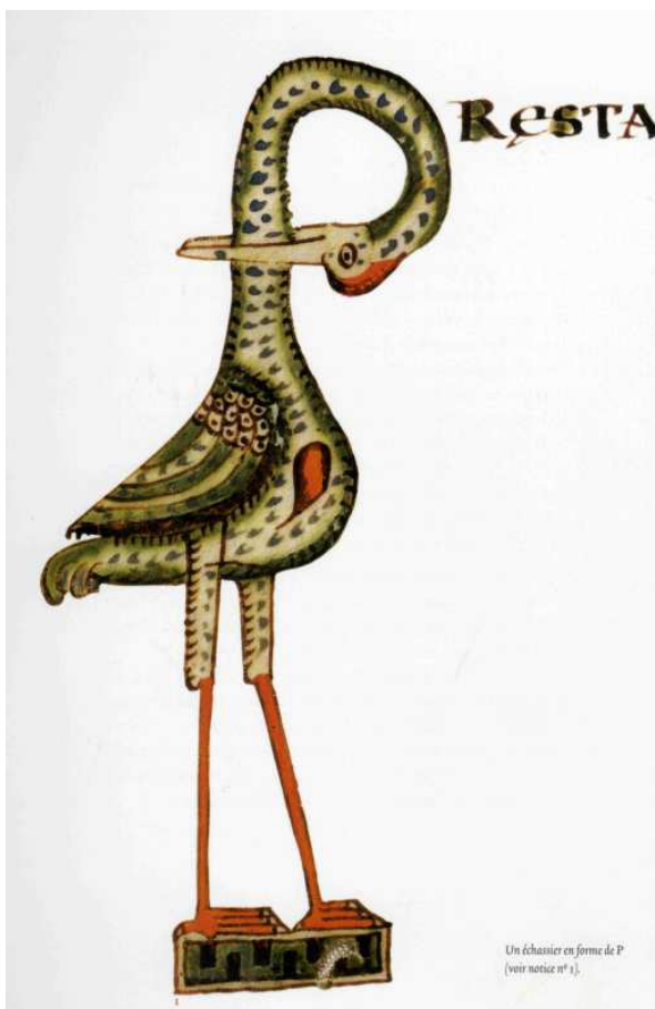
Echassier formant la lettre P